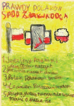
III miejsce – Andżelika Kociemba