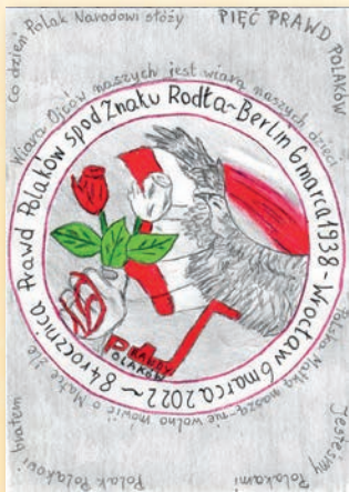
III miejsce – Wiktor Kozdroń